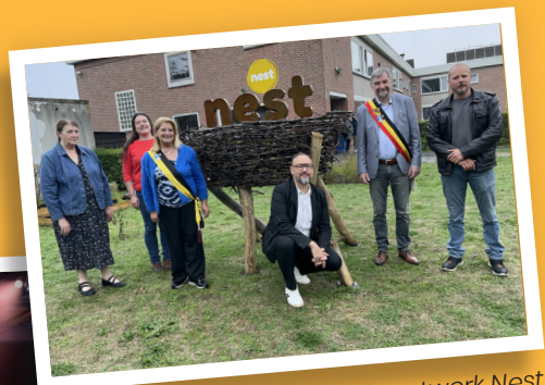
Onthulling kunstwerk Nest 15 oktober 2022