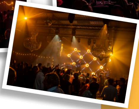
Het Feest van de Burgemeester op zaterdag 22 oktober in het Zeepreventorium was een groot succes.