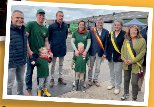
Dag van de Landbouw, Jerseyhoeve 18 september 2022